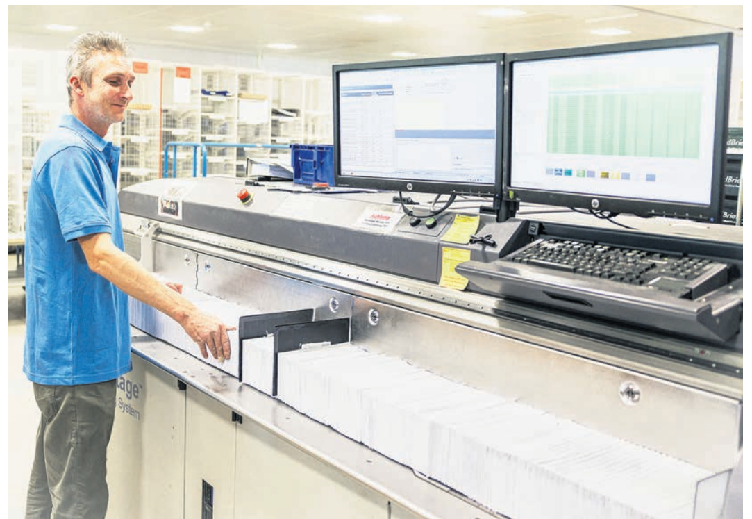
Bis zu 40.000 Briefe werden pro Stunde an einer Sortiermaschine am Produktionsstandort Lübeck verarbeitet.

Die Geschäftstätigkeiten erstrecken sich auf Kurier- und Postdienstleistungen sowie Drucken und Kuvertieren. Die Postdienstleistungen umfassen auch Abholung, Auslieferung, Sortie-