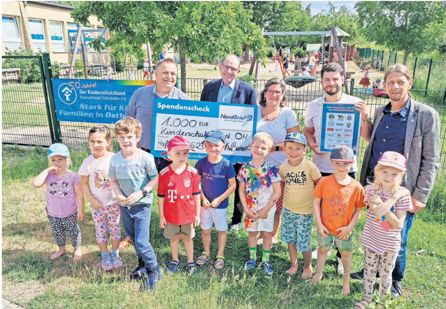
Große Freude bei Klein und Groß: Die 1000-Euro Spende kommt „100 Familien in Not“ zugute.