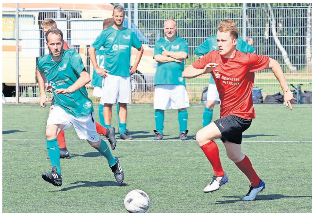
Die Marli GmbH in einem packenden Laufduell gegen die Sparkasse zu Lübeck.