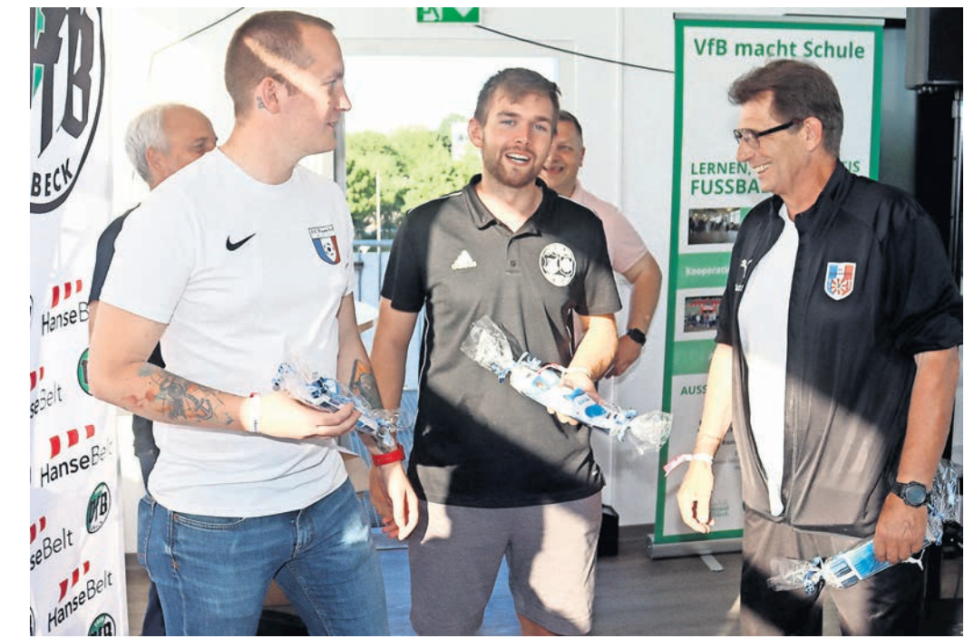
Die Schiedsrichter des Kreisfußballverbands Ostholstein sorgen für faire Bedingungen.