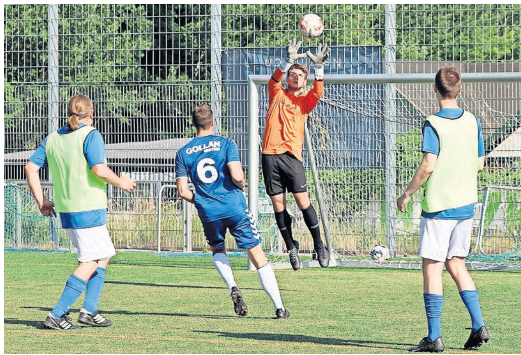
Blau trifft Blau – Gastgeber NordBrief im letzten Spiel gegen Gollan Lübeck.