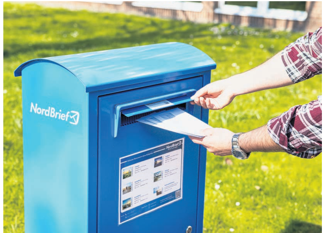
In der NordBrief Region finden Sie über 300 blaue Briefkästen und Annahmestellen.

Im Jahr 2021 führt NordBrief das Briefmarken-Abo für Geschäftskunden ein. Möglich ist fortan eine flexible Lieferung