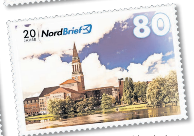
Jubiläumsbriefmarken mit nostalgischen Flair.

„Feiern Sie mit uns 20 Jahre NordBrief, und lassen Sie Ihre Briefe in zeitloser Eleganz erstrahlen! Danke, dass Sie Teil unserer Geschichte sind“, heißt es beim NordBrief Team.