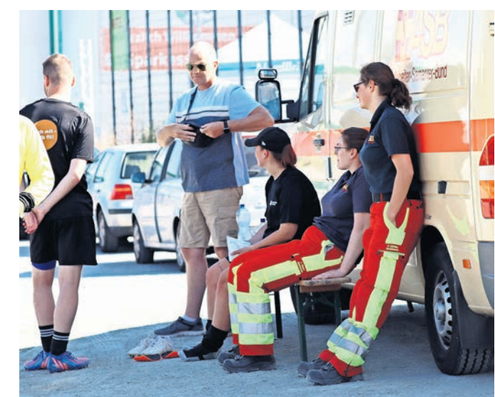
Die Sanitäter des ASB Lübeck standen für die Sicherheit der Teilnehmer bereit.