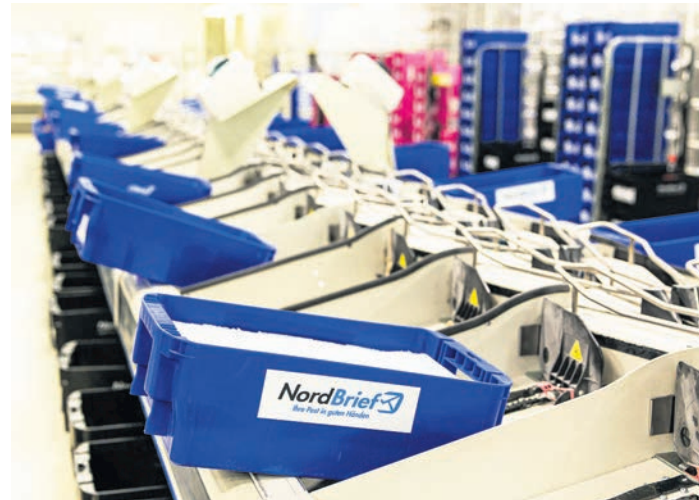
Das zentrale NordBrief Sortierzentrum liegt am Standort Lübeck.

Ob Werbesendung, Geschäftsbrief oder private Post. Mit NordBrief Briefmarken wirken Briefe persönlicher und verbindlicher als freigestempelte Briefe. Die große Auswahl an attraktiven Motiven aus der Region und die Möglichkeit, die Briefmarke individuell nach persönlichen Wünschen zu gestalten, verleihen Briefen das gewisse Etwas.