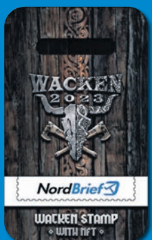
Sonderbriefmarke „Wacken Open Air“