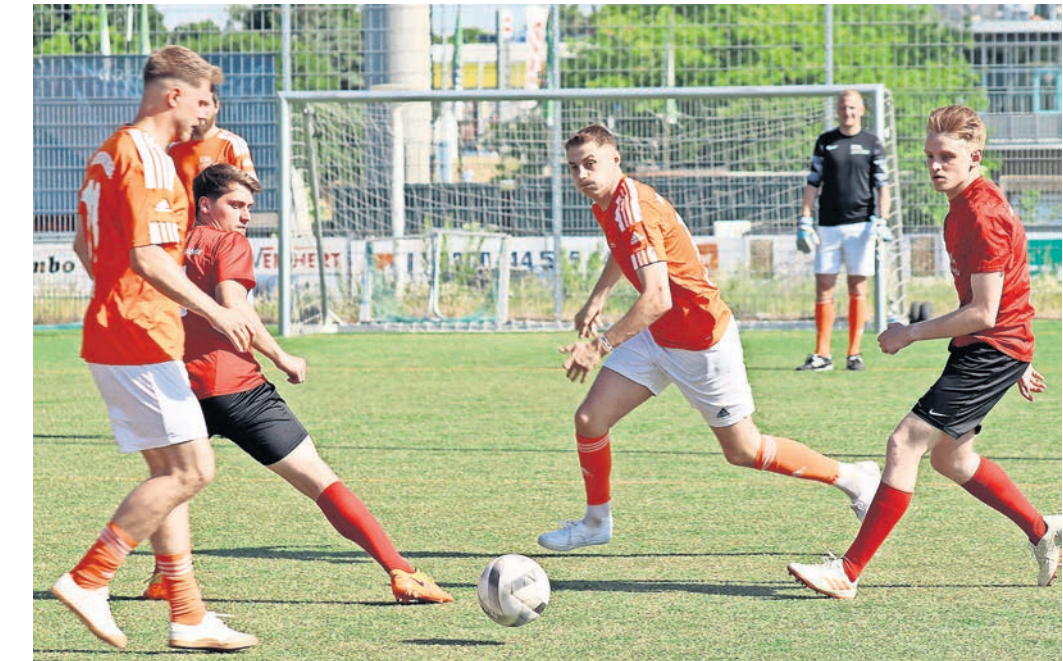
Das Finalspiel zwischen den Entsorgungsbetrieben Lübeck gegen die Sparkasse zu Lübeck.