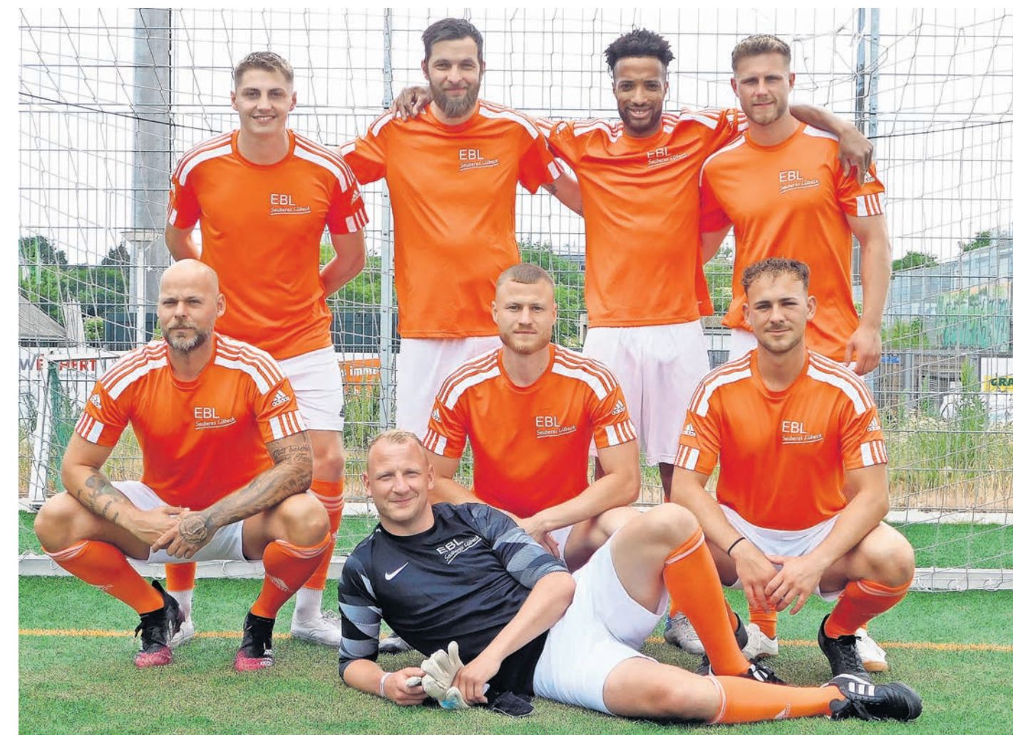
Die Entsorgungsbetriebe Lübeck haben sich den Wanderpokal souverän gesichert.