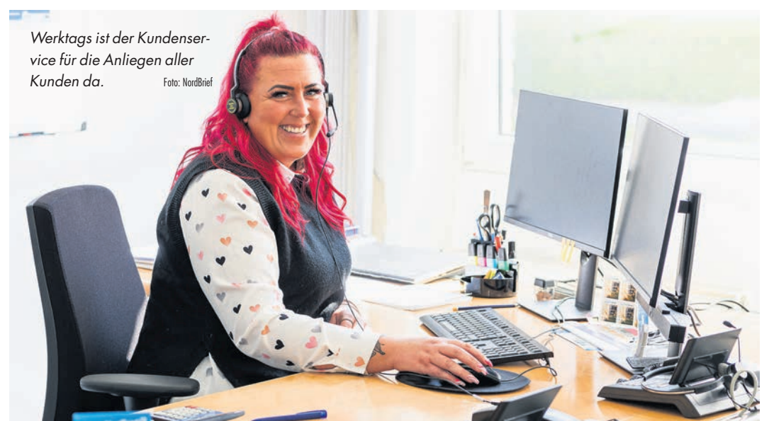
Werktags ist der Kundenservice für die Anliegen aller Kunden da.

https://www.nordbrief-ostsee.de/serviceleistungen/