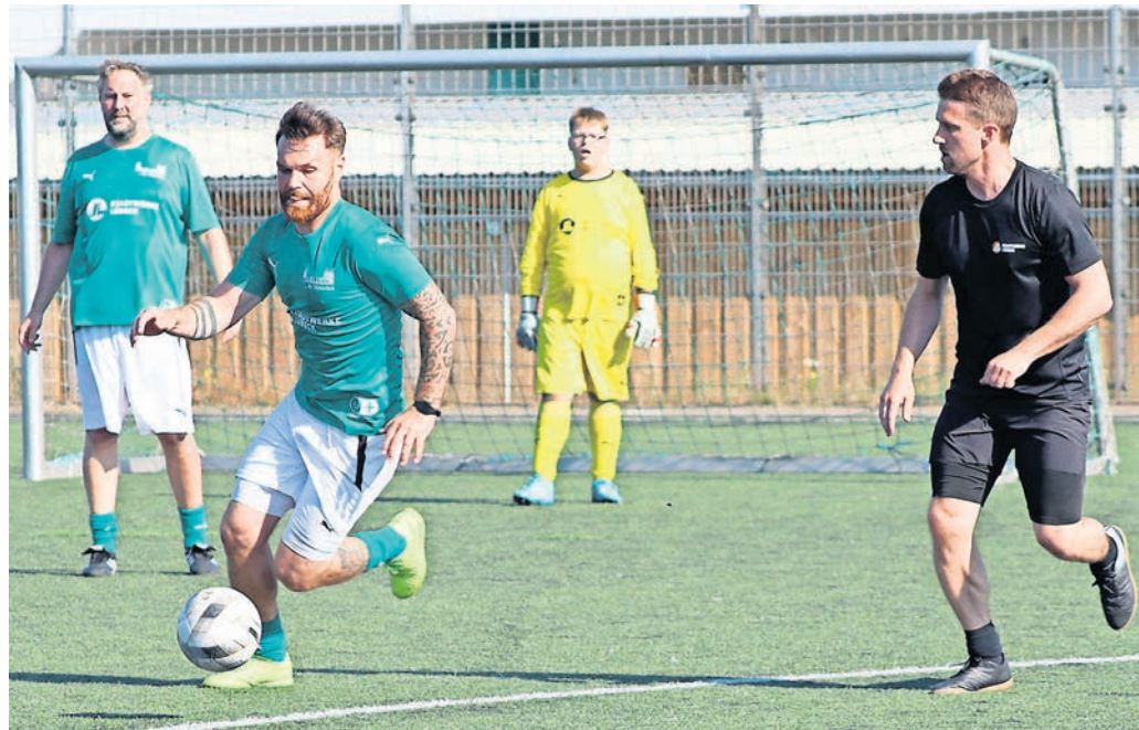
Das Inklusionsteam der Marli GmbH gegen die Stadwerke Lübeck.

Team der Entsorgungsbetriebe Lübeck gewann den Wanderpokal – Fußballturnier mit sechs Mannschaften